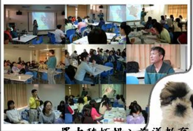
羅力積極投入海洋教育